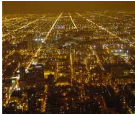
a | b