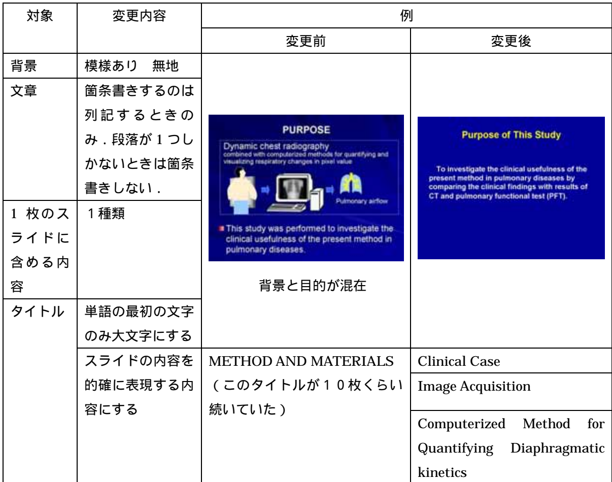
表1 RSNA 発表スライドの修正内容