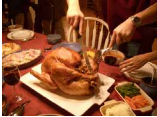
a | b